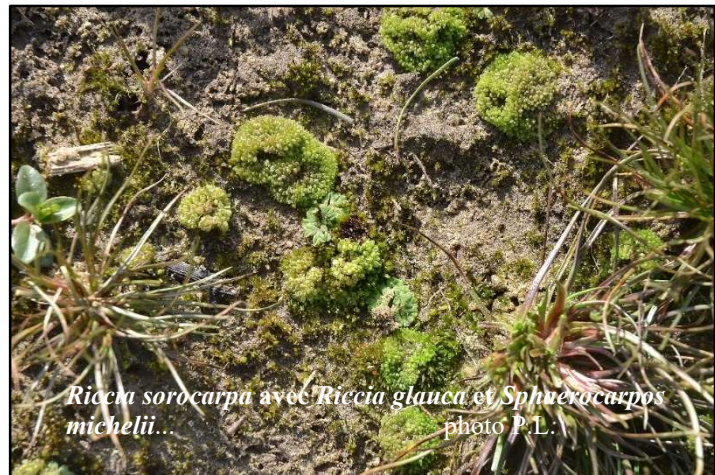
Riccia sorocarpa avec Riccia glauca et Sphverocarpos michelii ... photo P.L.

Espèce nouvelle pour le département découverte à Villery « La Montagne » en Forêt communale, 11.02.2022 ( det. Lanfant, vid. Bardet).